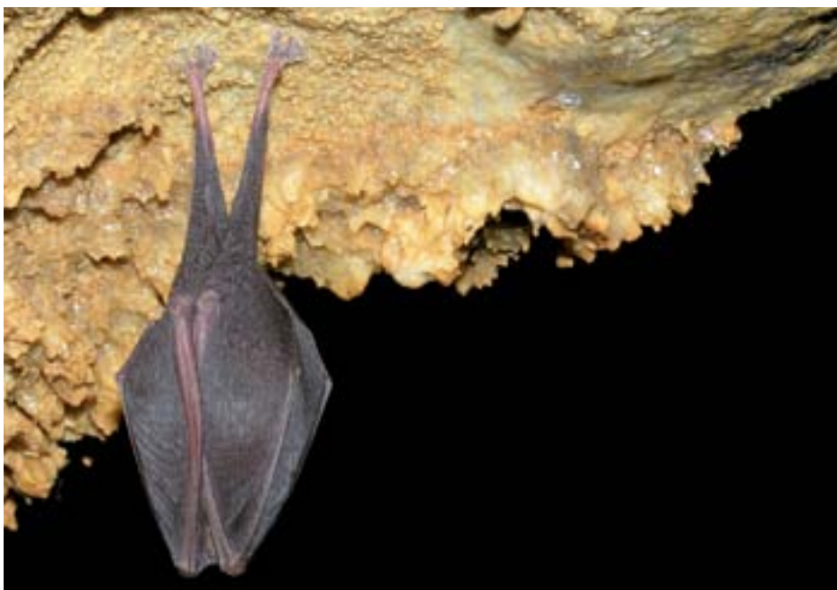
Obr. 3: Vrápenec malý ( Rhinolophus hipposideros ).

Vrápenec malý je nápadný druh, který se neukrývá ve štěrbinách, jedinci obvykle visí volně na viditelných místech, na rozdíl od netopýrů čeledi Vespertilionidae neumí šplhat. Jedná se o původně jeskynní druh, který ve střední Evropě začal zhruba ve stře-