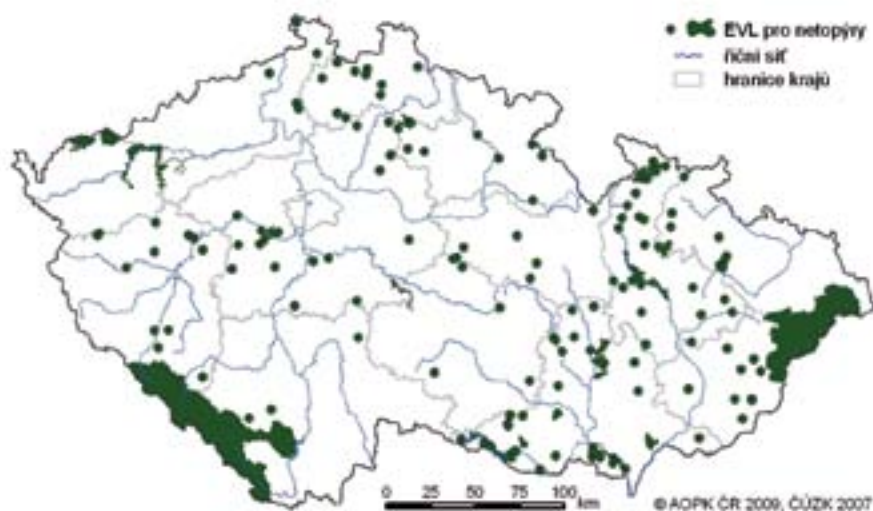
Obr. 7: Evropsky významné lokality vyhlášené pro ochranu netopýrů na území ČR

Kompletní verze prvních hodnotících zpráv včetně obecné části popisující přípravu soustavy Natura 2000 jsou dostupná například na internetových stránkách: http://ec.europa.eu/environment/nature/index_en.htm a na www.biomonitoring.cz .