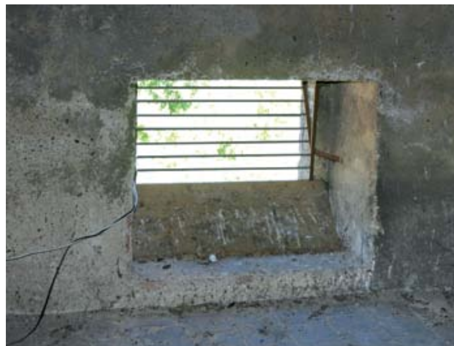
Obr. 9: Vhodné zabezpečení půdního prostoru proti holubům umožňující současně vlet netopýrů.

Práci s odklizením guána může usnadnit i položení velké igelitové folie na podlahu na jaře před přiletím netopýrů. Na podzim ji můžeme snadno sbalit a nahro-