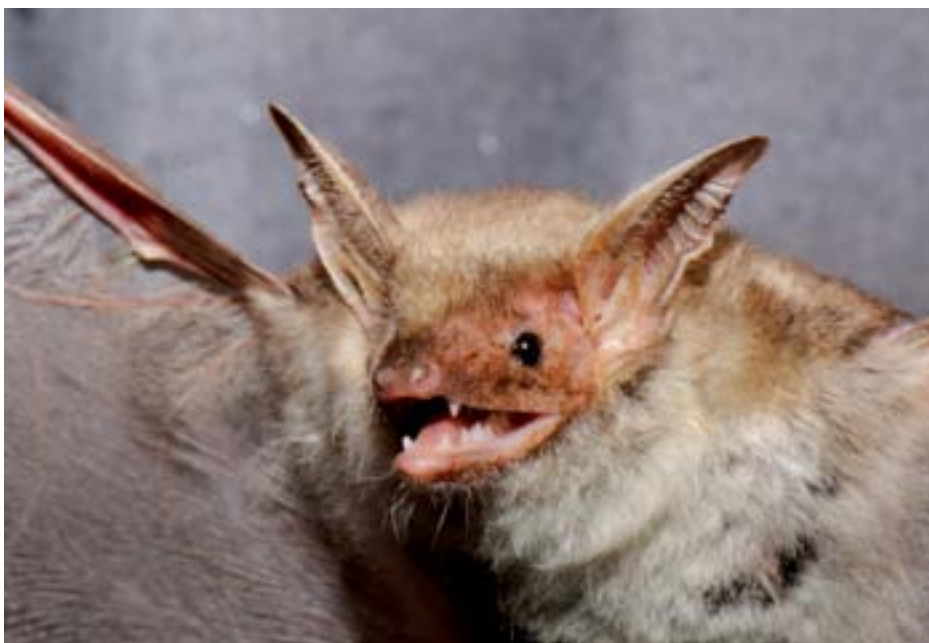
Obr. 4: Netopýr velký ( Myotis myotis ).