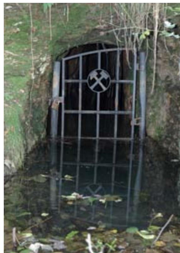
Obr. 16:

V České republice je již od konce 60. let 20. století organizováno sčítání netopýrů na zimovištích. V současnosti tuto činnost koordinuje Česká společnost pro ochranu netopýrů (ČESON) a Agentura ochrany přírody a krajiny ČR. Takto sledovaných lokalit je však jen několik stovek (a to včetně jeskyní, sklepů, bunkrů apod.), zatímco počet starých důlních děl přesahuje 2000 a celkově je na území ČR registrováno přes 15 tisíc důlních děl. Potřeba průzkumu před zajištěním či likvidací každého jednotlivého důlního díla je tedy zřejmá.