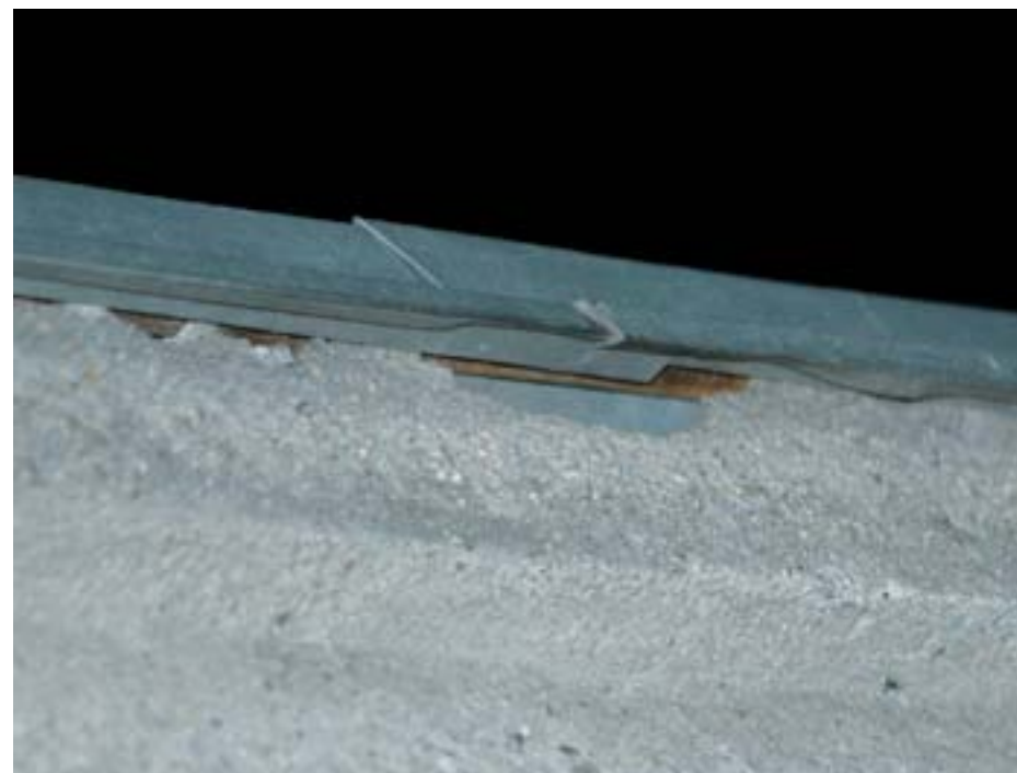
Obr. 10: Příklad štěrbinového úkrytu pod střešní krytinou.

Jak již bylo řečeno dříve, nejsou štěrbinové druhy netopýrů na svůj úkryt vázány natolik pevně jako předchozí skupina. Zánik jednoho úkrytu pro ně nemá tak katastrofické následky, protože obvykle v blízkém okolí znají několik dalších náhradních úkrytů. I přesto by však pracovníci ochrany přírody měli v každém jednotlivém