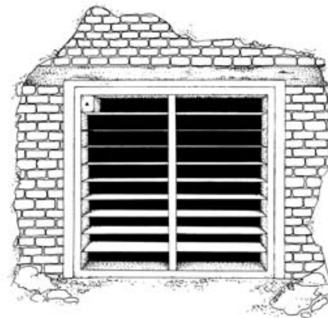
Obr. 12: Vhodná úprava vchodu do podzemních prostor – vodorovný vstup. Kresba: A. Peltanová

Zimující netopýři potřebují především klid a zachování mikroklimatu v prostorách, ve kterých se ukrývají. Tato místa tedy navštěvujeme co nejméně. Pokud je to potřebné a možné, zamezíme i vstupu nepovolaných osob do těchto prostor. Jedná se především o nejrůznější štoly, jeskyně a sklepy, které jsou nezajištěné a volně přístupné. Do těchto míst často pronikají např. trampové, montanisté, geologové nebo děti, kteří netopýry ruší nebo zde dokonce rozdělávají ohně, takže znemožňují klidné přezimování netopýrů.