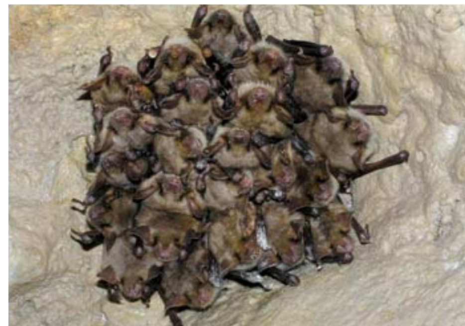
Obr. 2: Skupina zimujících netopýrů velkých ( Myotis myotis ).

V tomto období netopýři nepřijímají potravu a energii čerpají pouze z tukových zásob, které nashromáždili během podzimu. Zimní spánek není zcela nepřetržitý, netopýři občas procitají, aby změnili místo v úkrytu, zbavili se nahromaděných produktů metabolismu, popřípadě aby přelétli do úkrytu jiného. Každé probuzení je však pro netopýra energeticky velmi náročné, proto by v průběhu zimování ne-