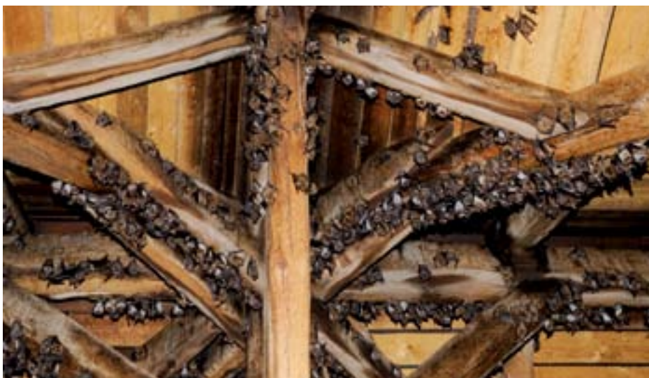
Obr. 8: Letní kolonie netopýra velkého ( Myotis myotis ).

O plánované opravě se často dozvíme v období, kdy není možné se přesvědčit o existenci kolonie přímým zjištěním netopýrů v objektu. Jejich přítomnost ale prozradí zbytky trusu na podlaze půdy. Od myšího trusu se liší tím, že je na povrchu hrboilatější, lze jej snadno rozdrtit a obsahuje lesklé zbytky hmyzu (tykadla, krovky, nožičky, motýlí šupinky).