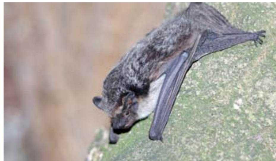
Obr. 19: Netopýr pestrý ( Vespertilio murinus ).

Tradičně uváděné pověry (například že se netopýři zamotávají lidem do vlasů nebo že člověka mohou sami napadnout, sát lidskou krev a podobně) již v současnosti mezi veřejností nejsou příliš rozšířené. Místo toho se však lidé obávají reálnějších