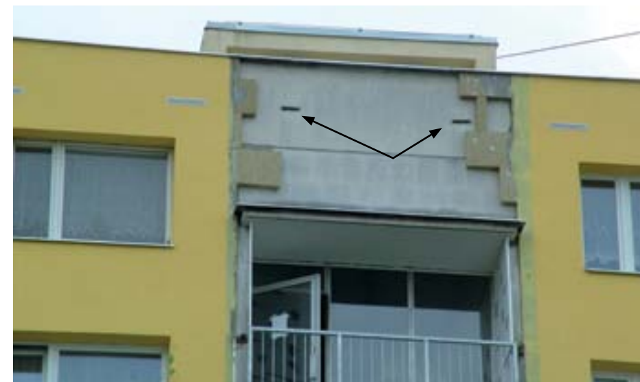
Obr. 17: Příklad úkrytu netopýrů v panelovém domě, který je při zateplování budov ohrožen.

V současnosti stále častěji dochází k výskytu mnohdy i početných skupin netopýrů v různých úkrytech, které jim poskytují sídliště s panelovou zástavbou (větrací šachty, štěrby mezi panely, štěrby za izolací, škvíry pod vodorovnou střešou apod.). V těchto úkrytech se mohou netopýři objevit v období přeletů, mohou zde zimovat a také zde může sídlit letní kolonie. Nejtypičtějšími druhy nalézányými v panelových domech jsou netopýr rezavý, netopýr pestrý, netopýr hvízdavý a netopýr večerní. Jsou to druhy, které v přírodě využívají jako úkryty dutiny starých stromů, štěrby za jejich kůrou a skalní pukliny. Proč tedy tyto netopýři vyhledávají panelové domy? Důvodů může