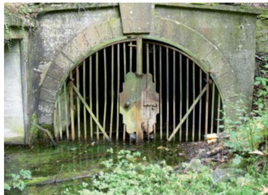
Obr. 14, 15: Příklad nevhodného zabezpečení vchodu do podzemních prostor.