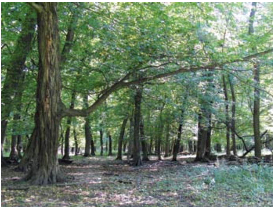
Obr. 11:

Tématem, které by si zasloužilo více pozornosti, je ochrana netopýrů v lesích. Klíčovým problémem je zajištění dostatečného množství úkrytů, tj. různých stromových dutin a štěrbin. Toho lze v dlouhodobé perspektivě dosáhnout pouze cíle-