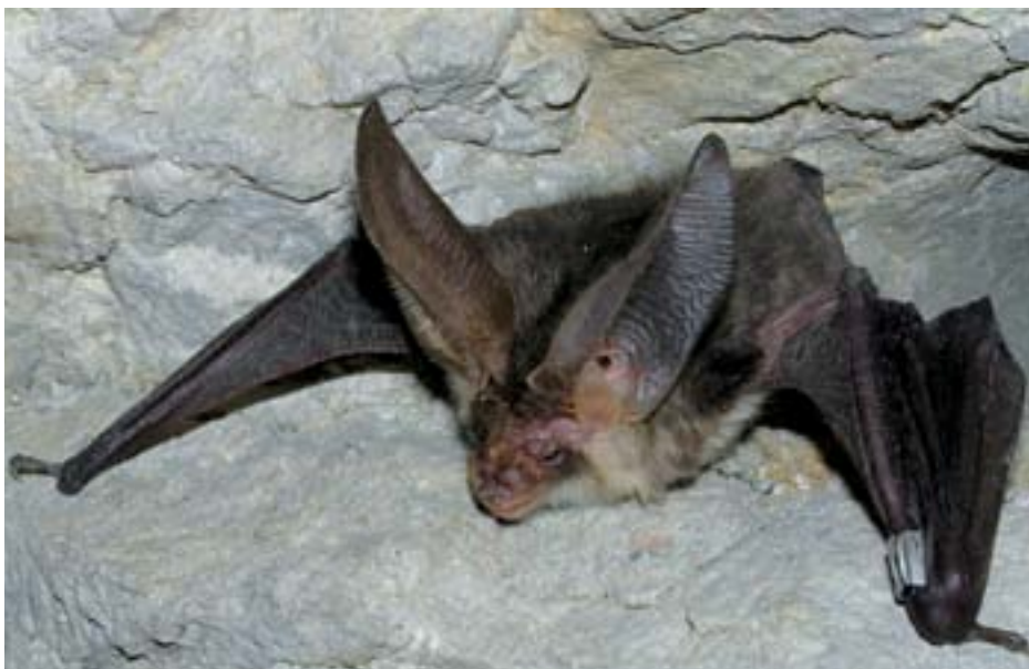
Obr. 6: Netopýr ušatý ( Plecotus auritus ).

Přestože se tento druh nejvíce jako přímo ohrožený, je třeba usilovat o jeho ochranu a zejména o zachování známých letních úkrytů a zimovišť.