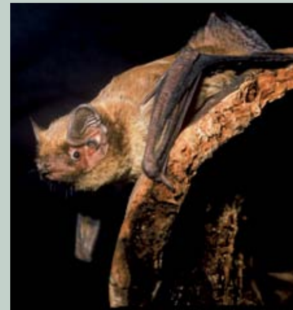
Obr. 1: Netopýr stromový ( Nyctalus leisleri ).

Řada druhů netopýrů využívá jako úkryty stromy v mokřadních oblastech, například v lužních lesích.