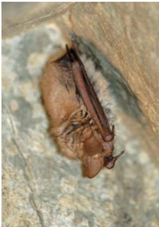
Obr. 5: Netopýr brvitý ( Myotis emarginatus ).

Netopýr brvitý je teplomilný, původně jeskynní druh. Kolonie samic s mláďaty lze v našich podmínkách nalézt na půdách větších budov (např. zámků). Těchto lokalit je však v České republice jen několik (okolo dvaceti) a jsou obývány většinou 50 až 150 jedinci (v několika případech však letní kolonie čítají přes 700 kusů). Netopýr brvitý zimuje v jeskyních, štolách a dalších podzemních prostorách. Ani na nejvýznamněj-